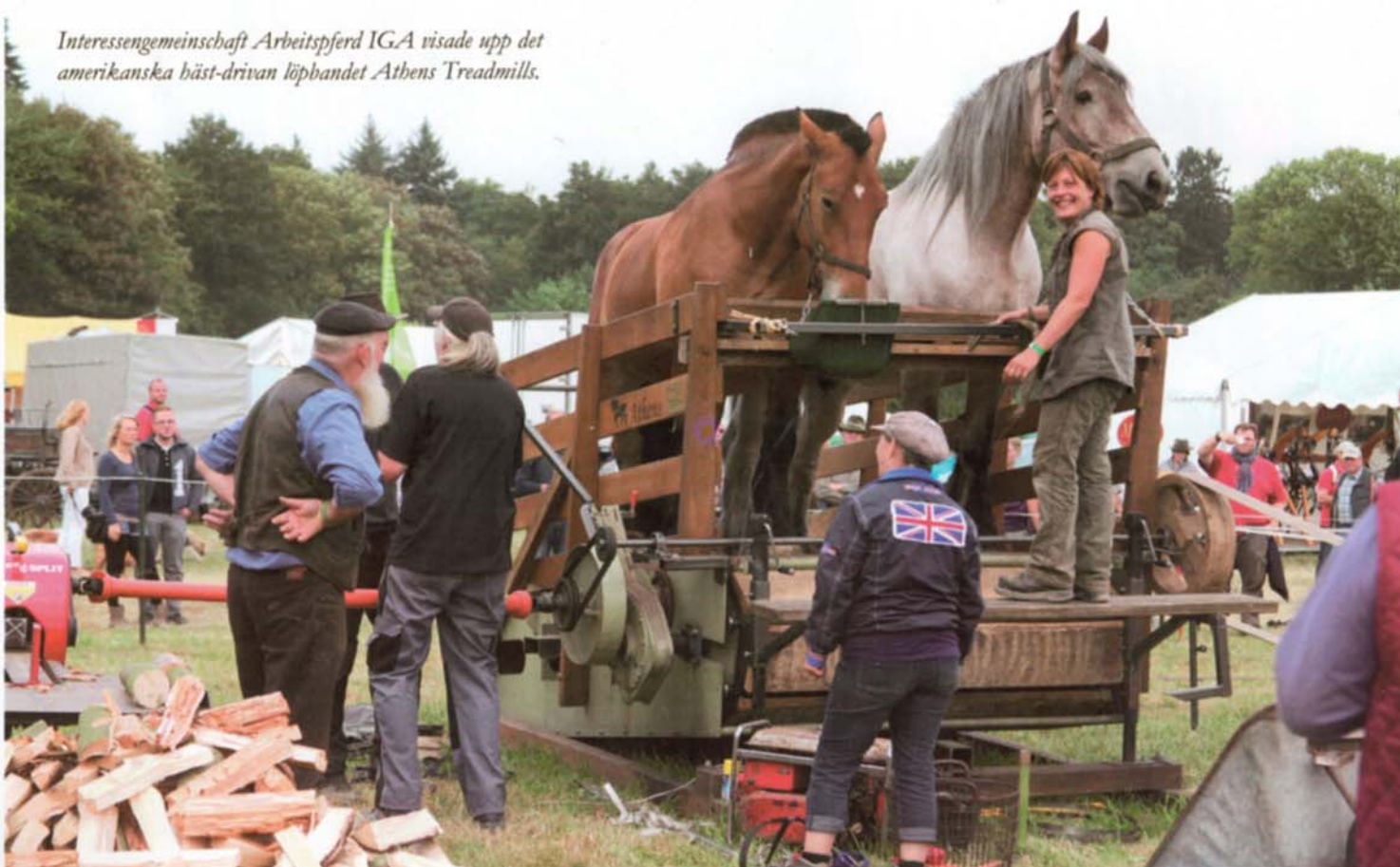
Interessengemeinschaft Arbeitspferd IGA visade upp det amerikanska häst-drivan löpbandet Athens Treadmills.

ekipagen körde och demonstrerade. Här visades allt från de enklaste förställen till avancerade, moderna förställ med motor och hydropump. Publiken fick följa med till flera olika stationer där de började med att visa gödselspridare, sedan plogar, harvar och olika hackor. Mycket nytt men även mycket gammalt. Där den största skillnaden syntes på utvecklingen var på fältet där de demonstrerade redskap för höslätter. Moderna förställ med motor som drev slätterkniven, hövänderen eller strängare.