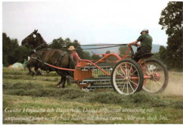
Günter Hupmann och Paquette. Däligt tillpassad utrustning och anspänning samt nervös häst bidrog till denna turen. Allt gick dock bra.