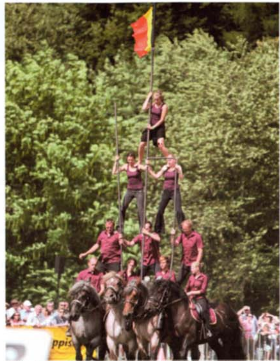
Finalnumret på showarenan. Människa-häst-pyramiden med Team van de Vijver från Belgien.

Pferde Stark har arrangerats sedan 1996 och är ett återkommande evenemang vartannat år. Nästa gång blir 2015 och för dig som är intresserad av att bruka med häst är detta ett evenemang värt att åka till.